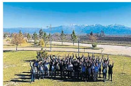
Aula en el campo. Treinta productores participaron en la primera edición del Diplomado en Gestión Frutihortícola Sustentable.

Esta primera experiencia, inédita para el sector, se llevó adelante entre los meses de mayo y noviembre de 2017. Fue definido en tres grandes módulos: Management, Gestión Sustentable e Innovación Productiva y tendencias para el negocio agrícola. La iniciativa finalizó con la presentación de un plan de mejora puntual, aplicado al negocio propio. La creación de contenidos estuvo a cargo de los expertos en las distintas temáticas de Grupo Arcor junto a académicos de la Universidad Austral de Rosario, quienes cuentan con el expertise técnico y profesional para llevar adelante esta iniciativa.