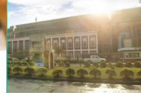
El ingenio La Princesita, del grupo Arcor, alcanzó una certificación avanzada en la industria de la cosecha automática y gestión de la producción de caña. ver más