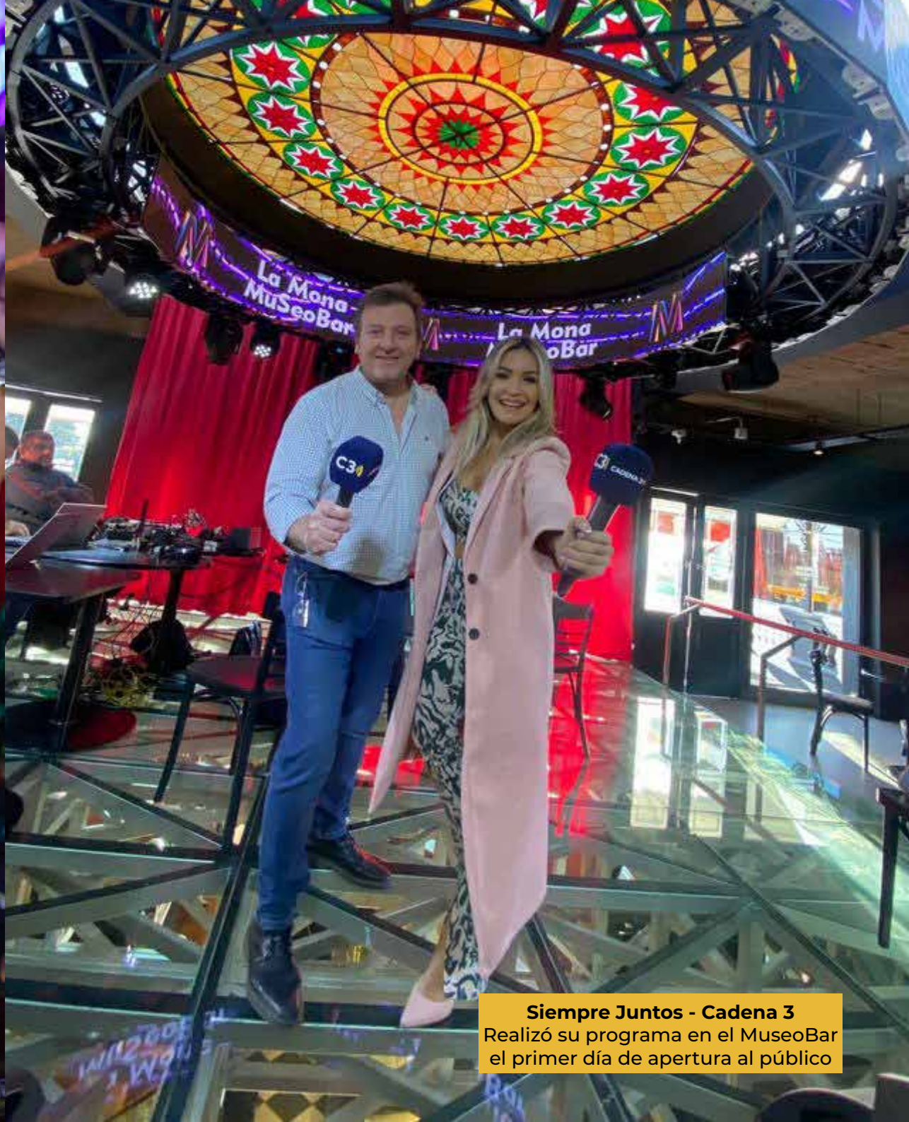
Siempre Juntos - Cadena 3 Realizó su programa en el MuseoBar el primer día de apertura al público