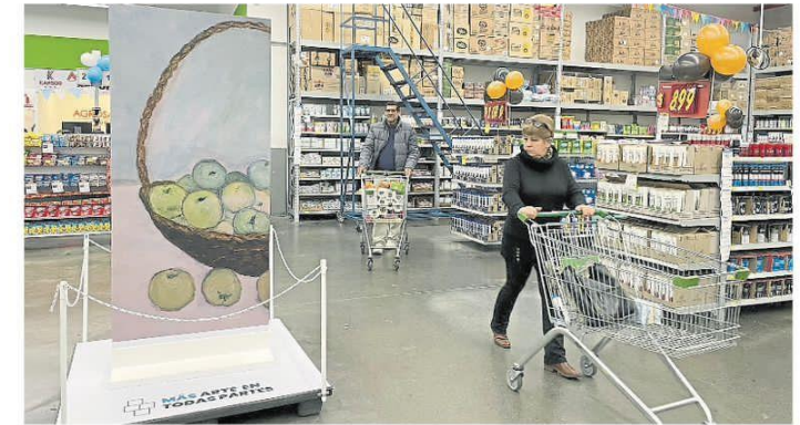
Reproducción de Los membrillos de Schiavoni exhibida en el ChangoMás de Catamarca

ARTE. Se lanzó la segunda edición de una iniciativa federal impulsada por la Asociación Amigos del Museo Nacional de Bellas Artes para llegar con el patrimonio a nuevos públicos