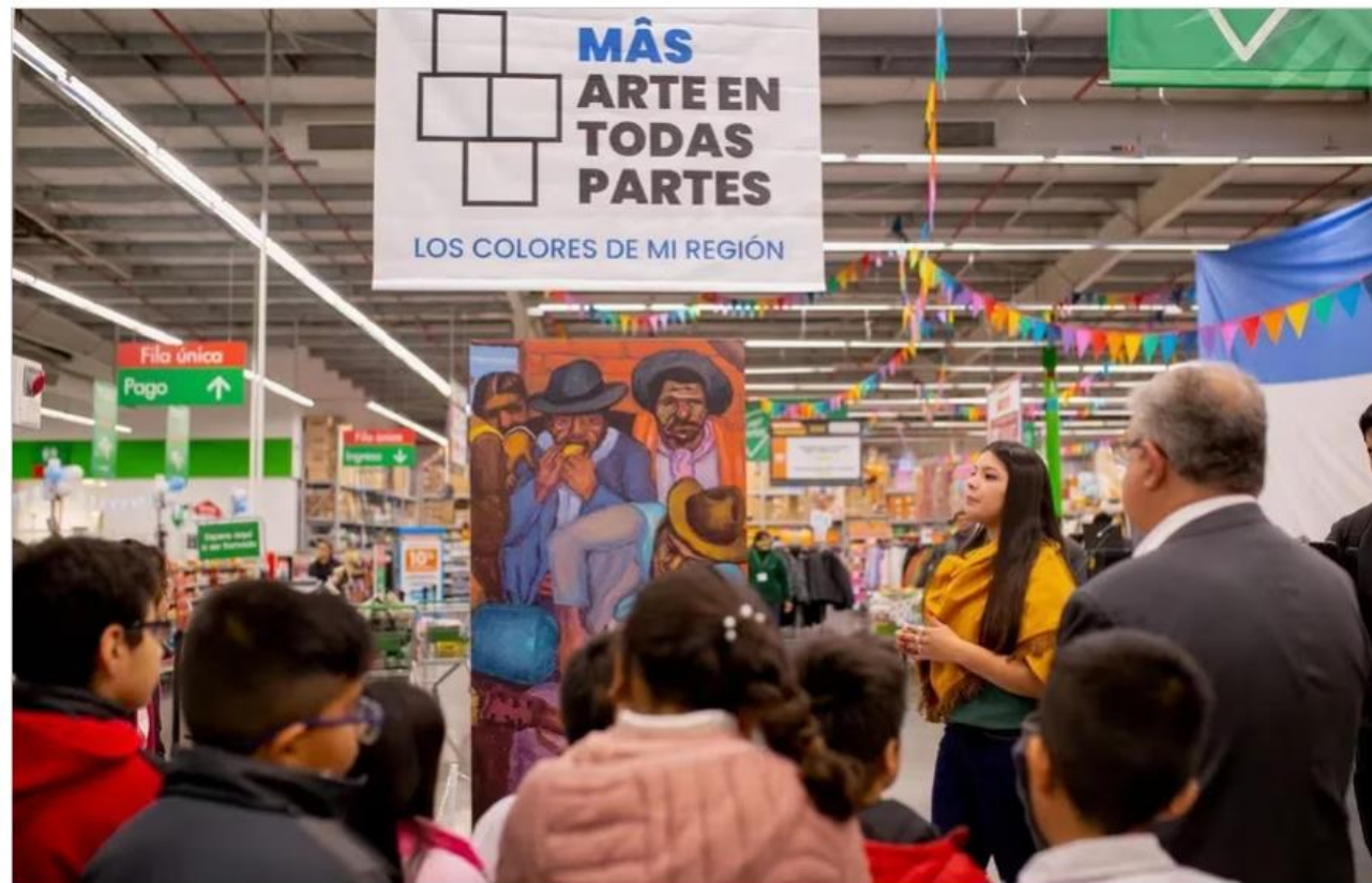
El gobernador Raúl Jalil participó de la visita guiada con alumnos en el ChangoMás de Catamarca