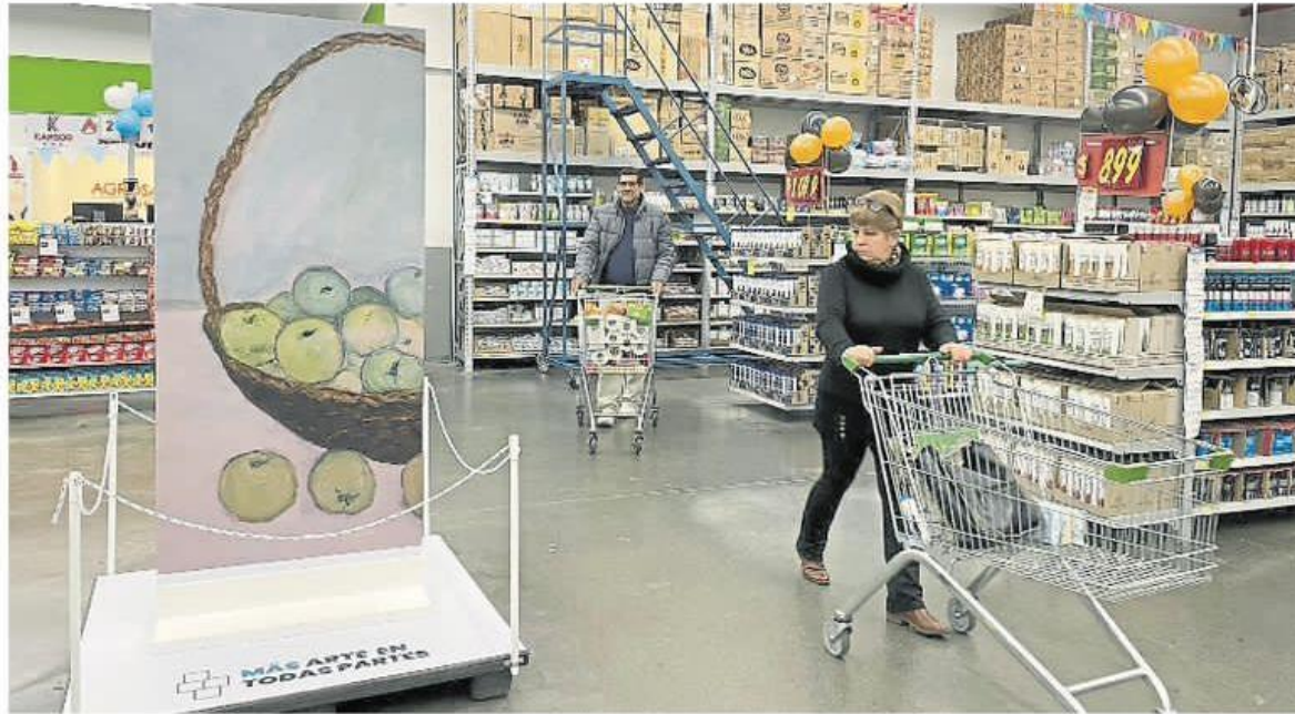
Reproducción de Los membrillos de Schiavoni exhibida en el ChangoMás de Catamarca

ARTE. Se lanzó la segunda edición de una iniciativa federal impulsada por la Asociación Amigos del Museo Nacional de Bellas Artes para llegar con el patrimonio a nuevos públicos