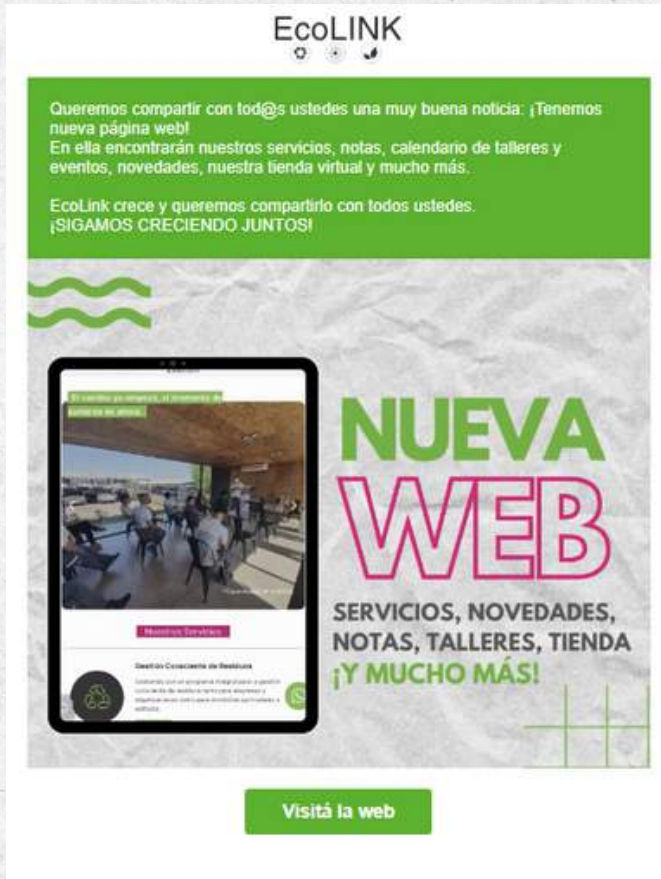
Campaña mailing lanzamiento web