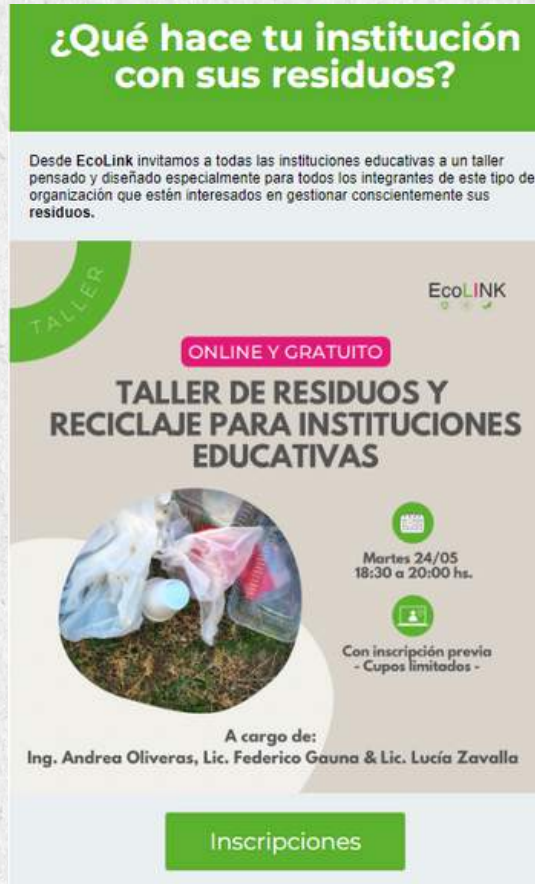
Campaña mailing para instituciones educativas